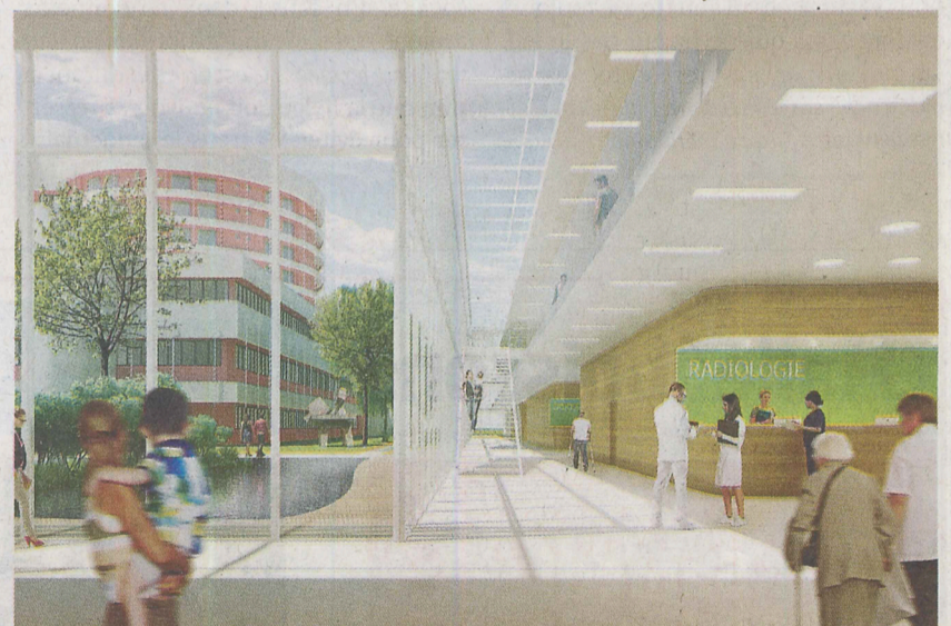
La circulation du personnel et du public a été soigneusement étudiée.